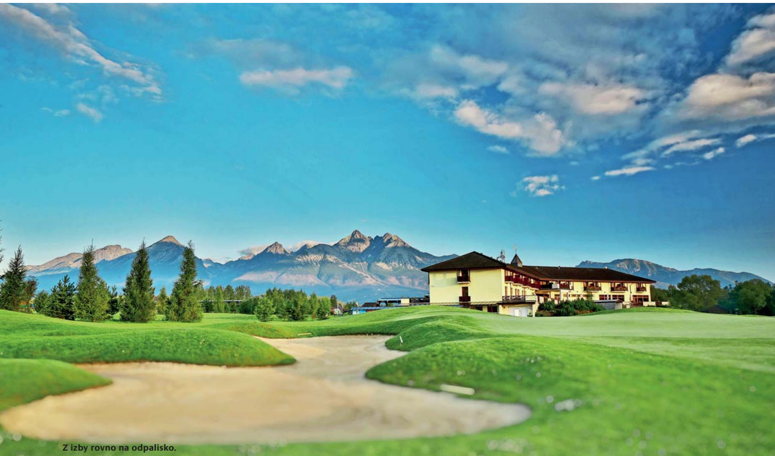
Z izby rovno na odpalisko.

areálu s informáciami o prírodných hodnotách okolitého prostredia.