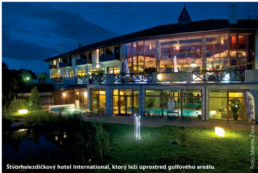
Štvorhviezdičkový hotel International, ktorý leží uprostred golfového areálu.