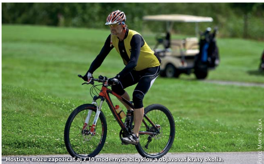
Hostia si môžu zapožičať aj z 10 moderných bicyklov a objavovať krásy okolia.

Samostatnou kapitolou je elegantný štvorhviezdičkový hotel International, ktorý leží uprostred golfového areálu.